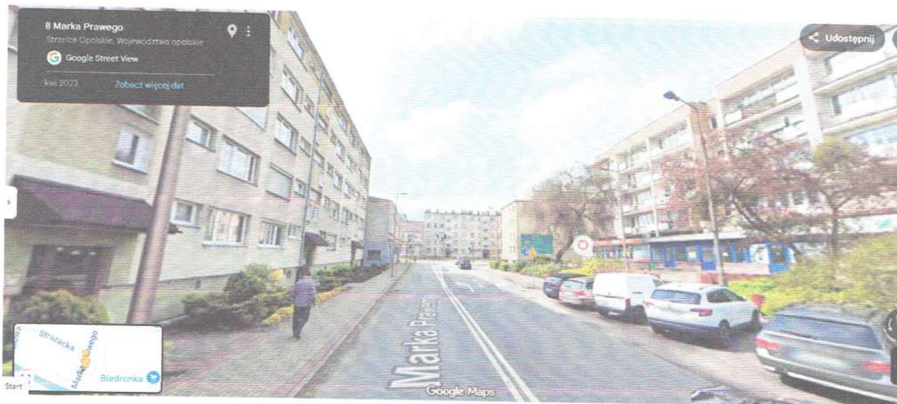
Zdjęcie „po” modernizacji: ul. Marka Prawego (początkowe numery)